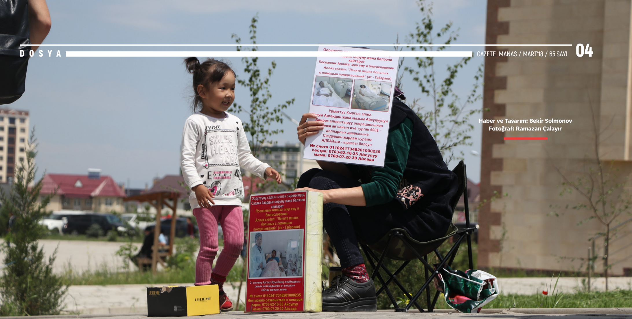
Haber ve Tasarım: Bekir Solmonov