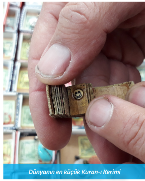
Dünyanın en küçük Kur'an-ı Kerim'i