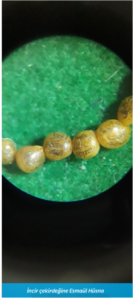
İncir çekirdeğine Esmâül Hüsnâ

Haber ve Tasarım: Argen Nadirkulov